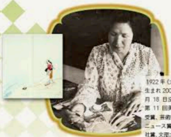
1922年(大正11年)1月3日生まれ 2003年(平成15年)10月18日没 日本手工芸協会会員、第11回美術展新人の部 金賞受賞、芸術新聞社員 受賞、手芸ニュース賞、全国手芸誌誌新聞社員、文芸大賞賞。