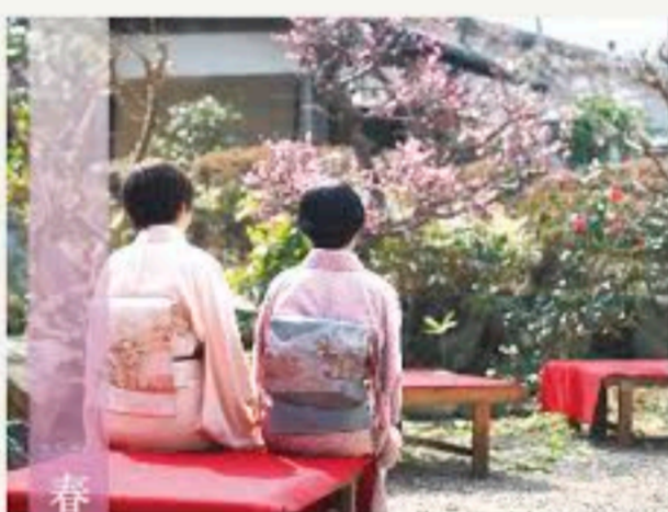
春の六進軒ひな茶席

※江戸時代に造られた書院式茶室「幽石軒庭園」も散策できます。庭を見ながら往時を聴せる静かな時間をお過ごしください。