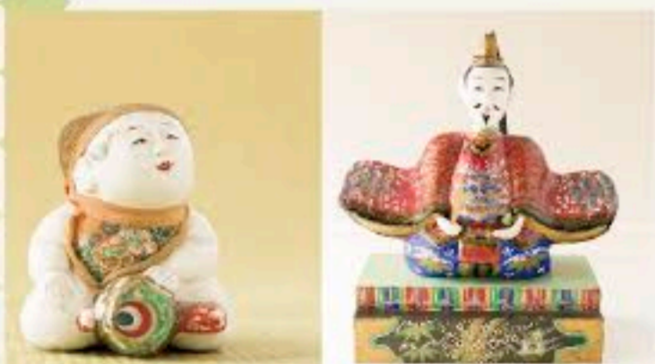
<左>織田家 鶴姫愛用の「御所人形」<右>丹波の伝統工芸品「稲畑人形」